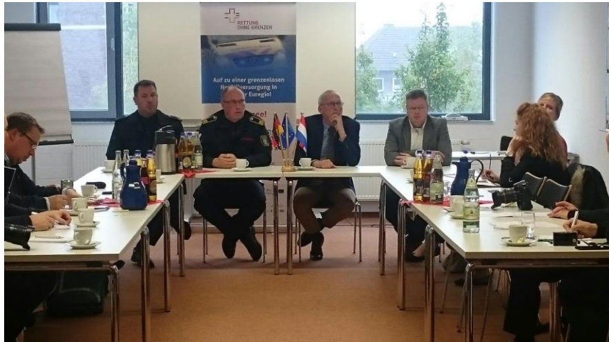
Persconferentie: Na afloop van de eerste grensoverschrijdende bijscholing voor Notfallsanitäter in Kreis Borken vond op 27 oktober 2016 een persconferentie plaats.

In 2017 en 2018 zullen in het kader van het project nog meer scholingen plaatsvinden. Het doel is in totaal rond 40 Notfallsanitäter in Kreis Borken bij te scholen. Naar verwachting zullen vanaf het tweede kwartaal 2017 de eerste Duitse ambulances over de grens kunnen rijden.