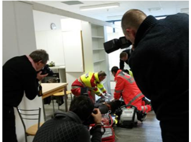
Casestudie: Duitse Notfallsanitäter oefenen de inzet bij de Nederlandse patiënt.